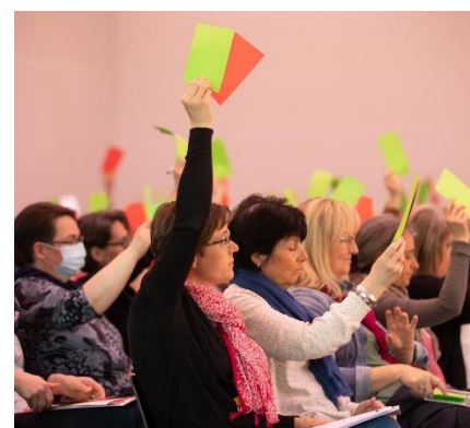
Impressions de l'Assemblée générale du 24 mars 2022.