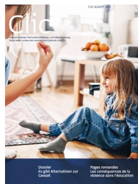
3/2022 Alternatives à la violence