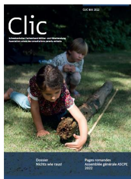
2/2022 Tous dehors !