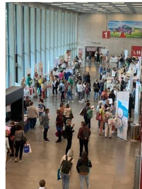
Impressions de l'Assemblée générale du 25 mai 2023.